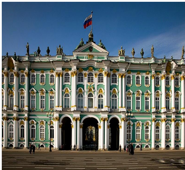
HERMITAGE (S. PIETROBURGO)